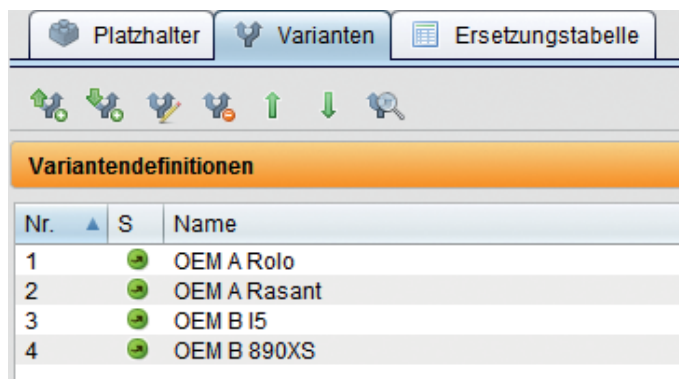
Abb. 1: Liste der Varianten eines Basisprojekts

Die TestBench bietet eine Tabelle für die Varianten und Platzhalter mit deren jeweiligen variantenspezifischen Werten. Es wurde ein Generierungsprozess aufgesetzt, der aus dem Bibliotheks-Projekt das variantenspezifische Testprojekt ableitet.